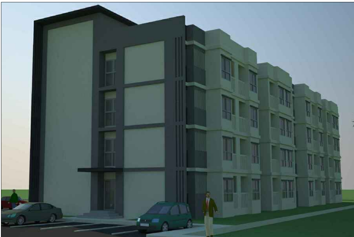
รูปทัศนียภาพ แนวทางที่ 3