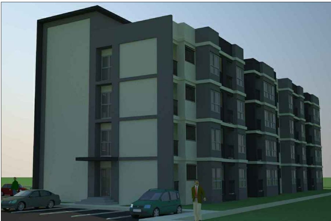
รูปทัศนียภาพ แนวทางที่ 1