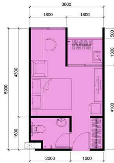
ห้อง 20 ตร.ม.