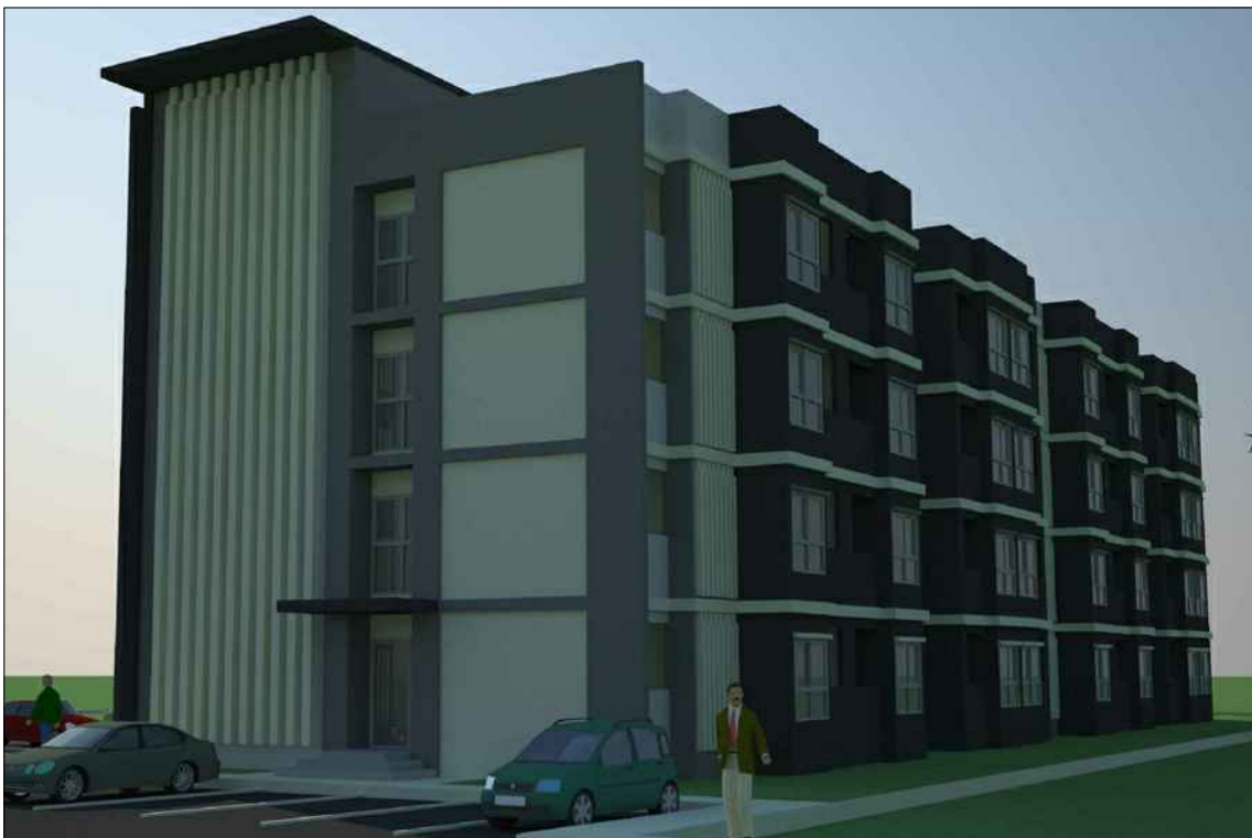
รูปทัศนียภาพ แนวทางที่ 2