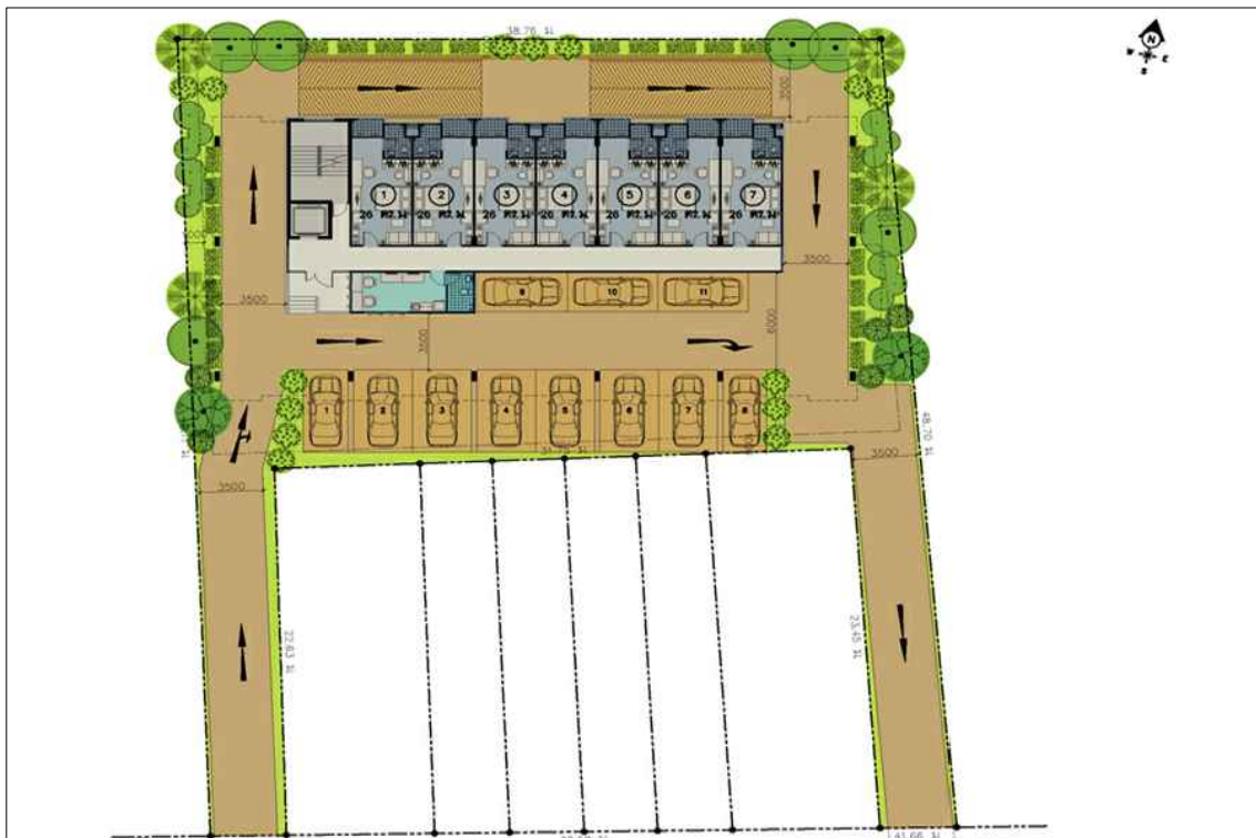
แปลนพื้นที่ดิน (บน) , แปลนพื้นที่ 1 (ล่าง)