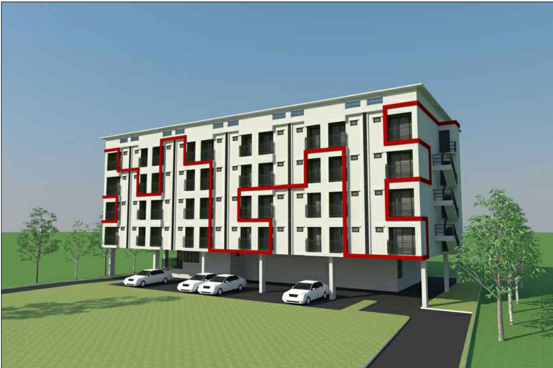
รูปทัศนียภาพ แนวทางที่ 2