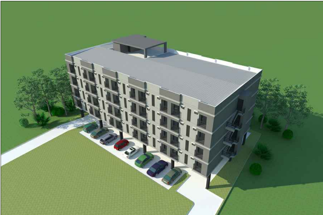
รูปทัศนียภาพ แนวทางที่ 3