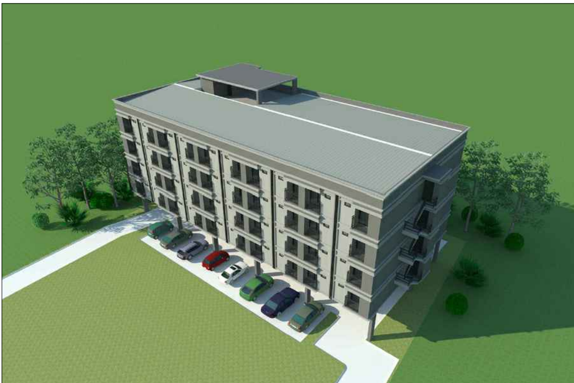
รูปทัศนียภาพ แนวทางที่ 1