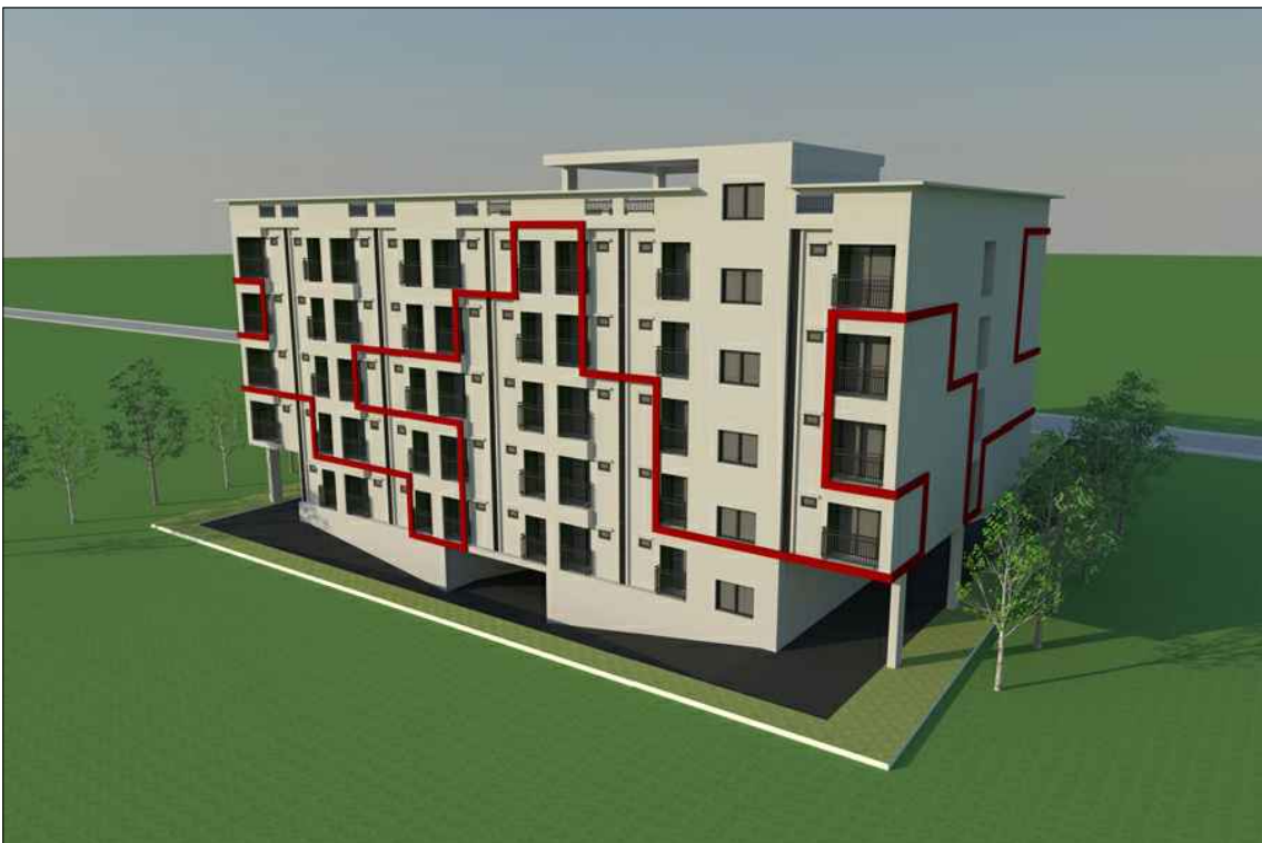
รูปทัศนียภาพ แนวทางที่ 2