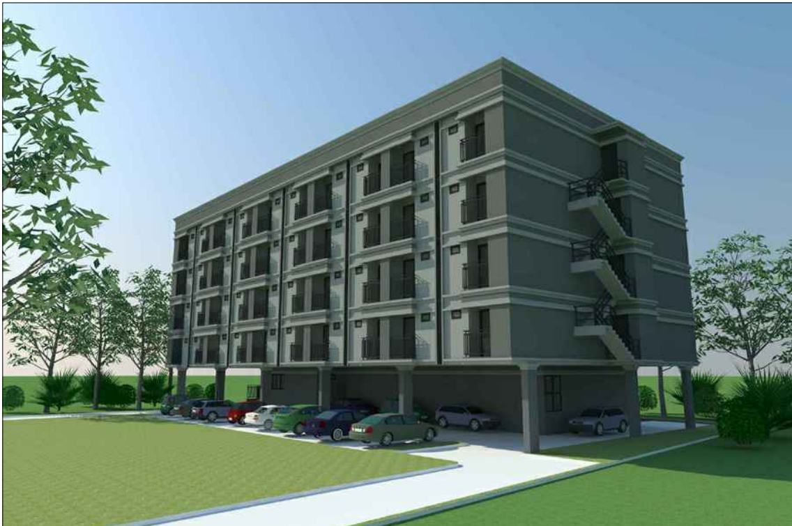
รูปทัศนียภาพ แนวทางที่ 1