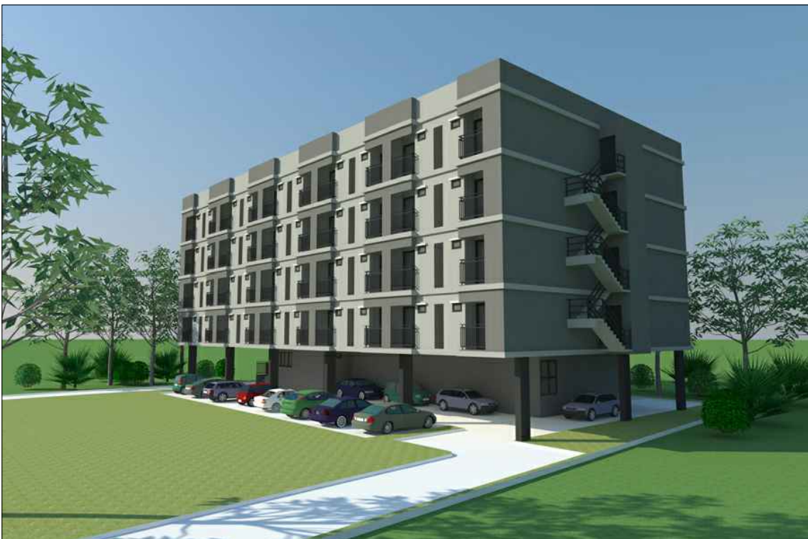
รูปทัศนียภาพ แนวทางที่ 3