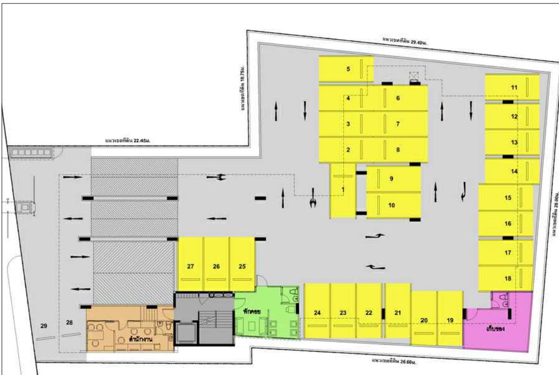
แปลนพื้นที่ดิน (บน) , แปลนพื้นที่ 1 (ล่าง)