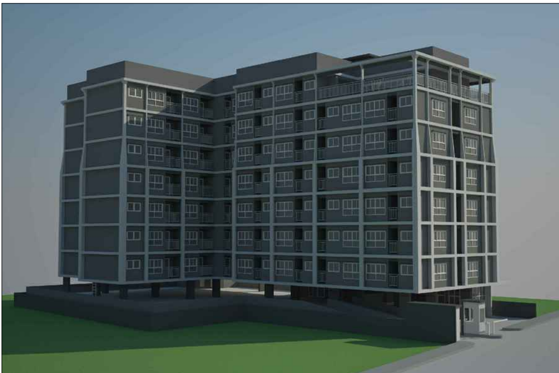
รูปทัศนียภาพ แนวทางที่ 1