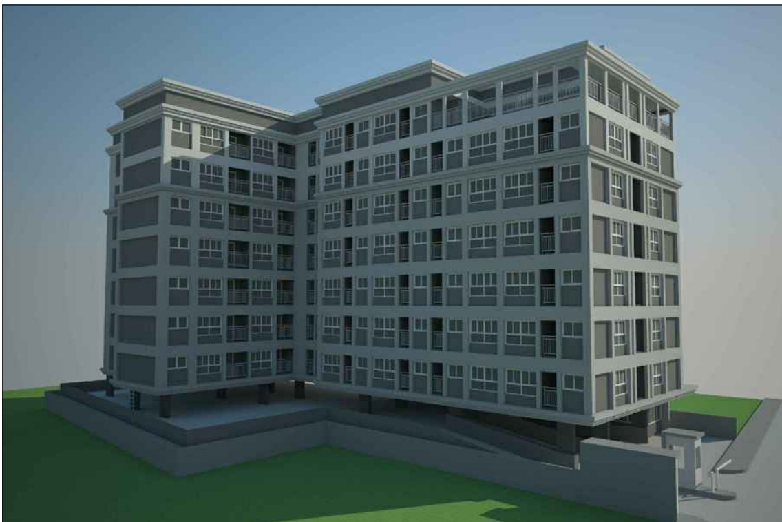
รูปทัศนียภาพ แนวทางที่ 2