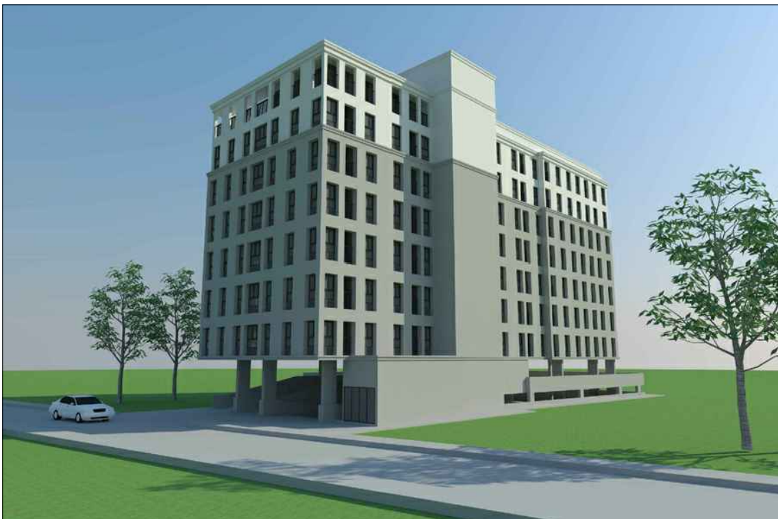
รูปทัศนียภาพ แนวทางที่ 3